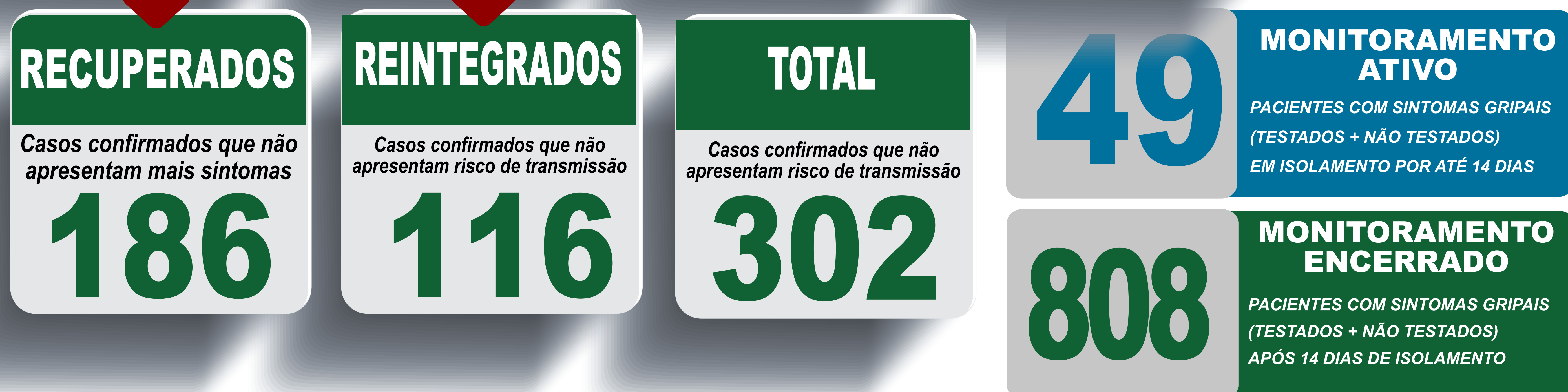
PLANILHA DE CASOS DE COVID-19 POR LOCAL DE RESIDÊNCIA, JABOTICATUBAS/MG