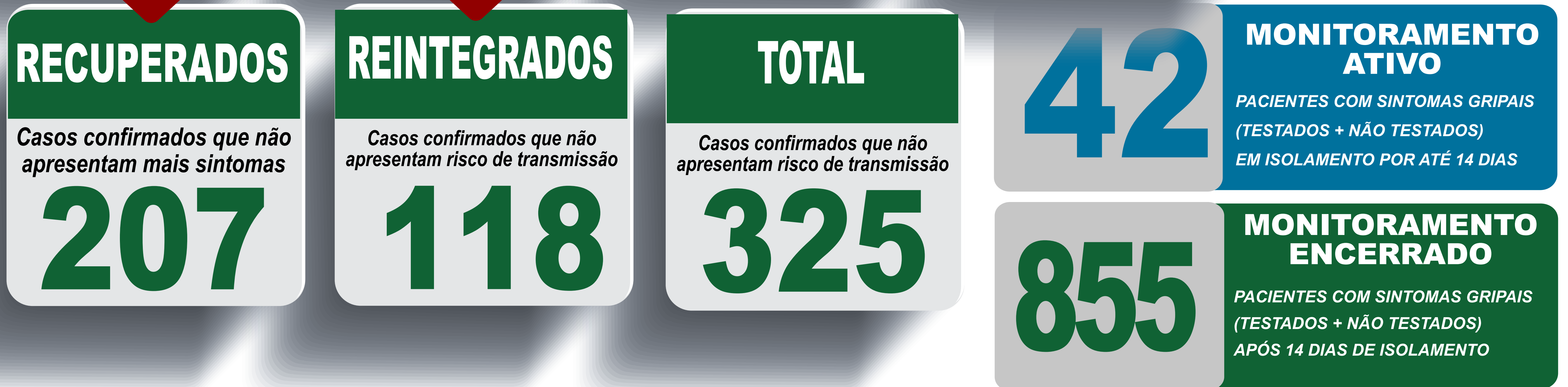
PLANILHA DE CASOS DE COVID-19 POR LOCAL DE RESIDENCIA, JABOTICATUBAS/MG