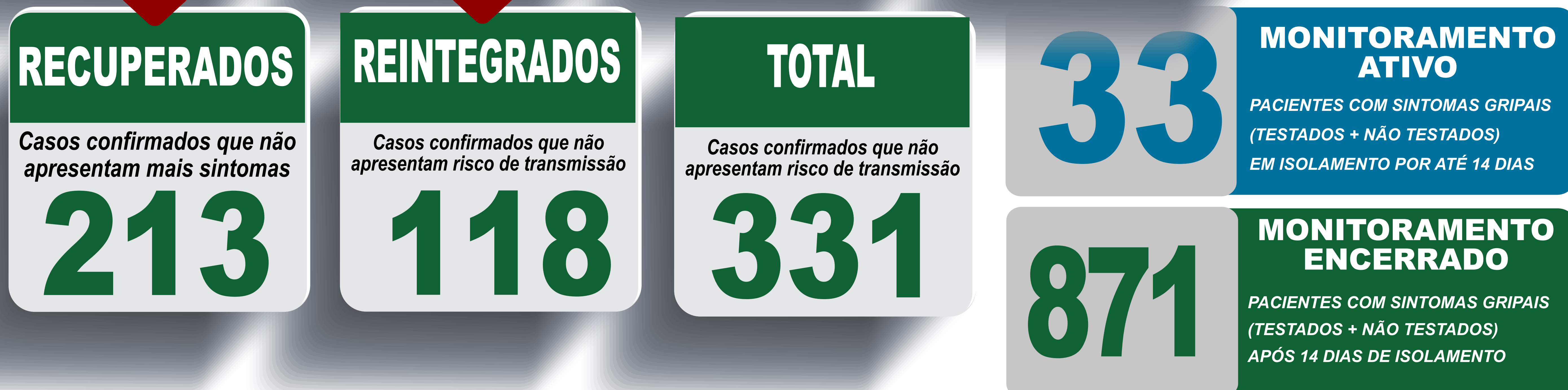
PLANILHA DE CASOS DE COVID-19 POR LOCAL DE RESIDENCIA, JABOTICATUBAS/MG