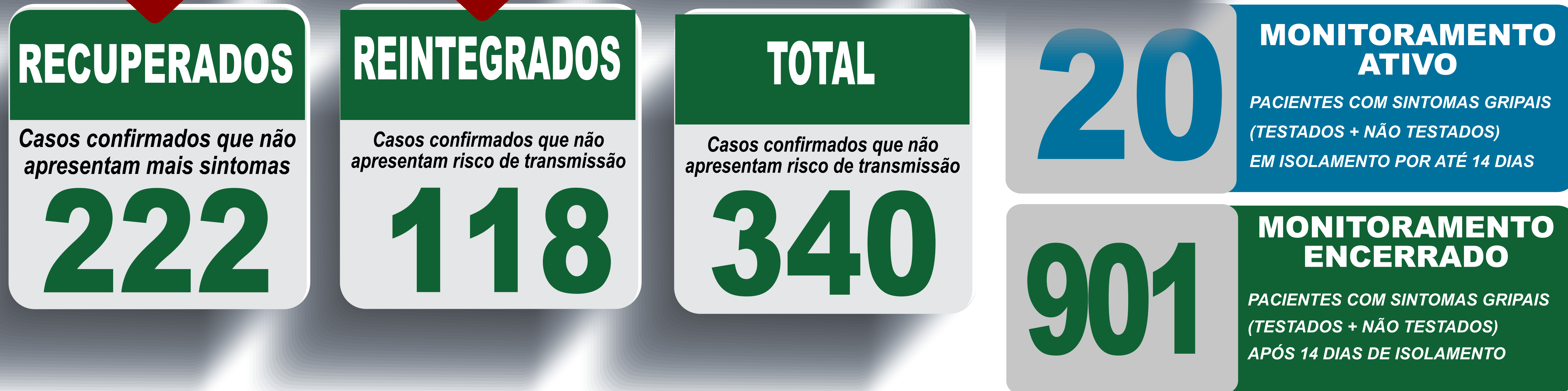
PLANILHA DE CASOS DE COVID-19 POR LOCAL DE RESIDÊNCIA, JABOTICATUBAS/MG