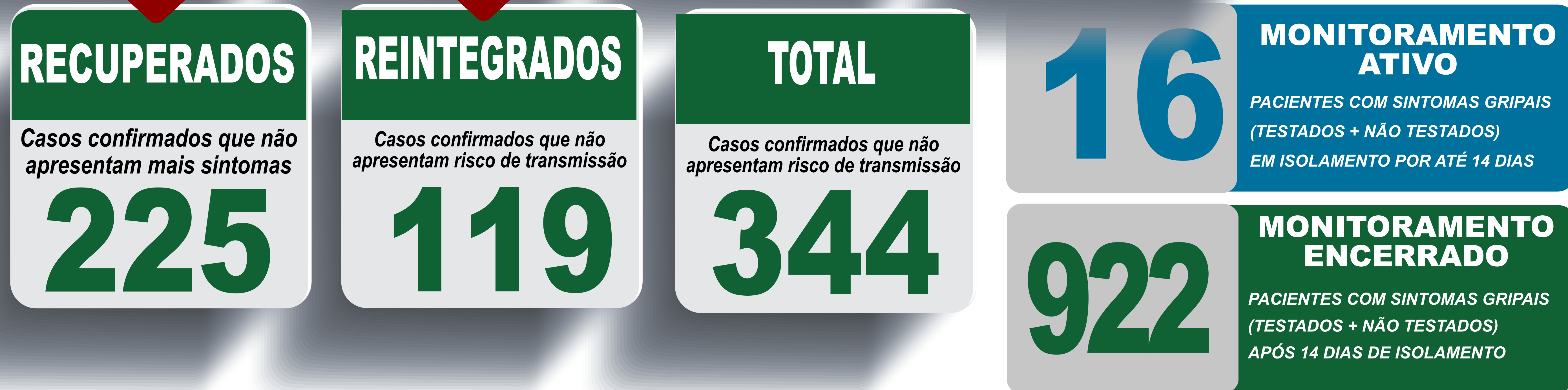
PLANILHA DE CASOS DE COVID-19 POR LOCAL DE RESIDÊNCIA, JABOTICATUBAS/MG