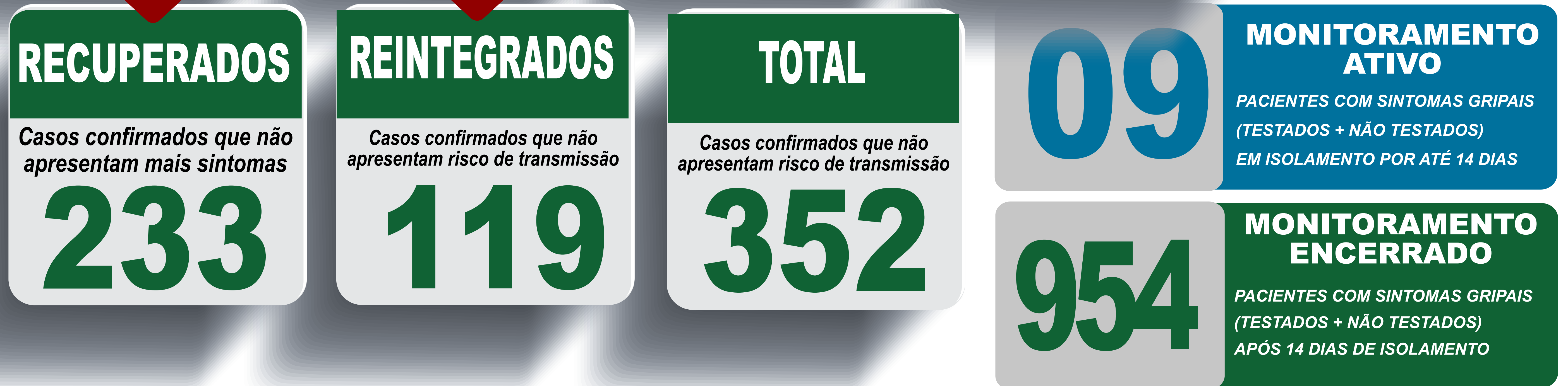
PLANILHA DE CASOS DE COVID-19 POR LOCAL DE RESIDÊNCIA, JABOTICATUBAS/MG