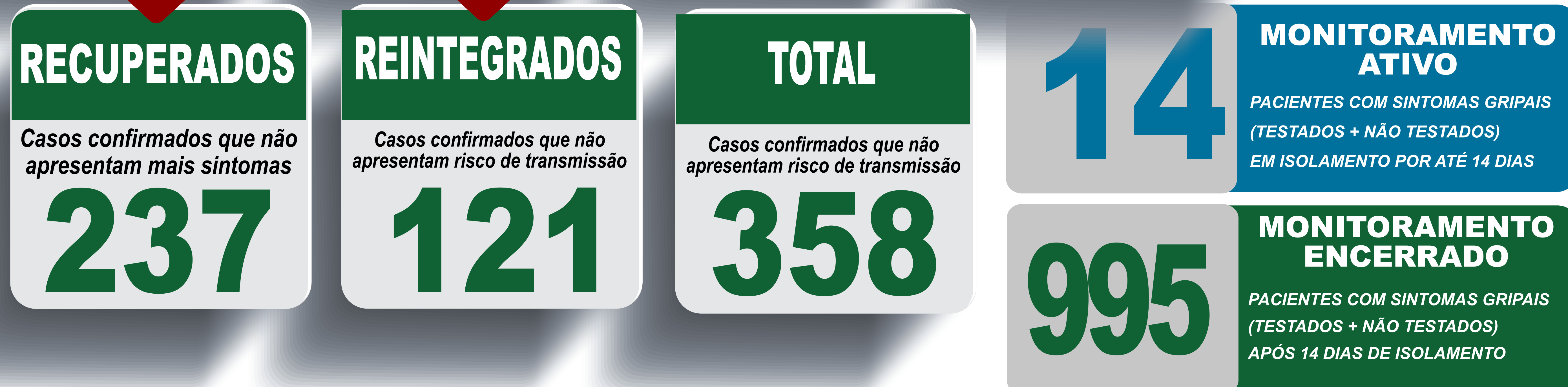
PLANILHA DE CASOS DE COVID-19 POR LOCAL DE RESIDÊNCIA, JABOTICATUBAS/MG