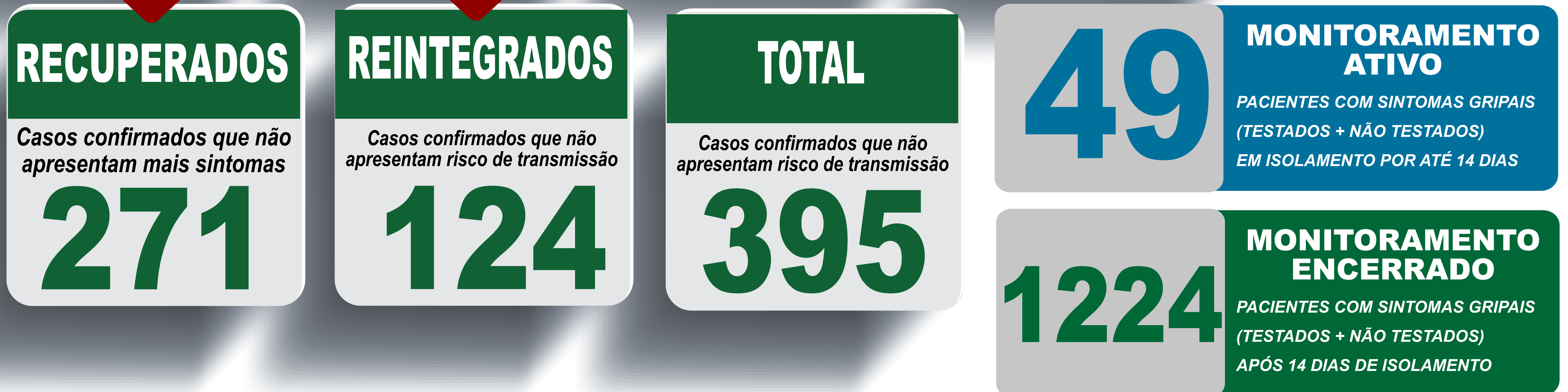
PLANILHA DE CASOS DE COVID-19 POR LOCAL DE RESIDÊNCIA, JABOTICATUBAS/MG