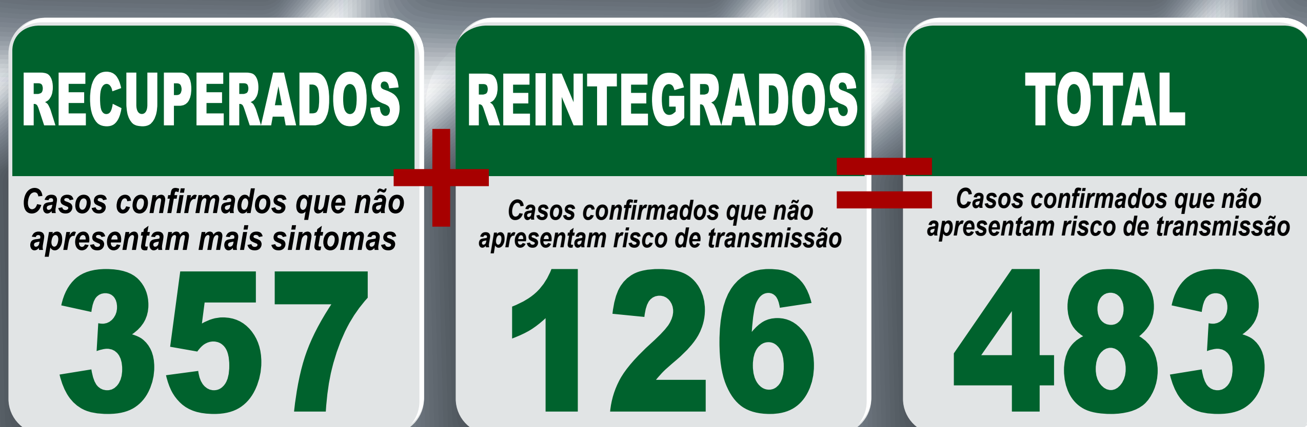
PLANILHA DE CASOS DE COVID-19 POR LOCAL DE RESIDÊNCIA, JABOTICATUBAS/MG