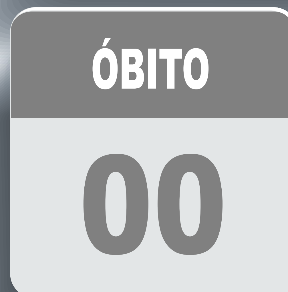
PLANILHA DE CASOS DE COVID-19 POR LOCAL DE RESIDÊNCIA, JABOTICATUBAS/MG