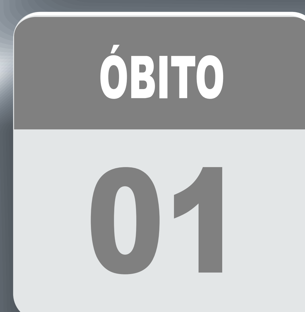
PLANILHA DE CASOS DE COVID-19 POR LOCAL DE RESIDÊNCIA, JABOTICATUBAS/MG