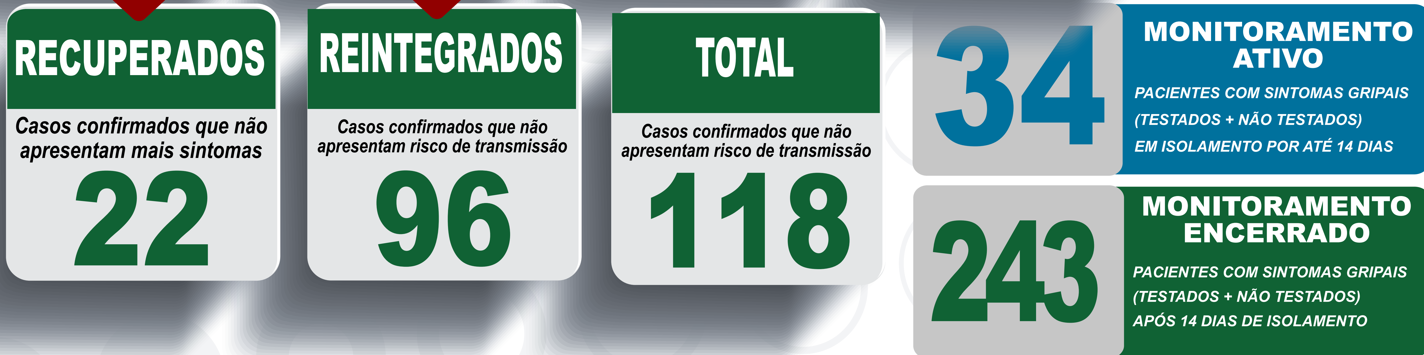
PLANILHA DE CASOS DE COVID-19 POR LOCAL DE RESIDÊNCIA, JABOTICATUBAS/MG