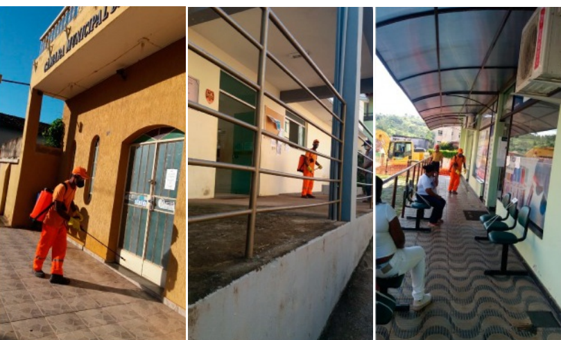
Higienização nos pontos de aglomeração

Muita coisa mudou desde o começo desta pandemia. Pessoas trabalhando de casa, outras sem trabalho, outras com trabalho reduzido e assim a economia do mundo e também da nossa cidade ficou prejudicada. O auxílio emergencial, lançado pelo governo federal, ajudou parte da população, mas houve pessoas que não conseguiram utilizar o aplicativo e com isso, a prefeitura disponibilizou assistência e orientação para os que tiveram dificuldade em realizar o cadastro. Além disso, a prefeitura municipal está distribuindo o Kit Merenda Escolar aos pais e responsáveis dos alunos da rede municipal e conseguiu da Coordenadoria Estadual de Defesa Civil (CEDEC) doação de cestas básicas, kits de higiene pessoal e equipamentos de proteção individual distribuídos a população já cadastrada na Secretaria Municipal de Desenvolvimento e Promoção Social.