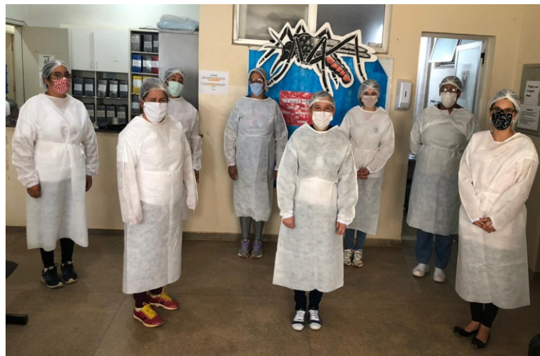
Equipamentos para os profissionais da linha de frente

Mesmo com todos os cuidados, no dia 10 de abril veio a confirmação do primeiro caso de coronavírus em Jaboticatubas. Desde então, a prefeitura adotou novos métodos de prevenção como o monitoramento (pelo Comitê Gestor do Plano de Prevenção e Contingenciamento em Saúde do COVID-19) do paciente infectado e de outras pessoas que tiveram contato ou apresentaram sintomas gripais suspeitos; higienização dos principais pontos de aglomeração, sendo que agora a higienização é realizada com quaternário de amônio; fechamento total (com exceção de farmácias e postos de combustíveis) dos comércios em dias estratégicos, visto a elevada concentração de pessoas na cidade; envio de equipamentos para o enfrentamento do coronavírus para a Fundação Hospitalar Santo Antônio (FHSA), entre eles um monitor cardíaco, oxímetro e termômetros a laser; aquisição de equipamentos de proteção individual (EPI) para os profissionais que estão na linha de frente; afastamento ou trabalho em casa dos funcionários que se encontram no grupo de risco; ampliação dos canais de denúncia por celular; informações sobre o COVID-19 nos meios digitais e uso obrigatório das máscaras de proteção individual, desde o dia 14 de abril.